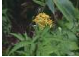
ハンゴンソウ 反魂草