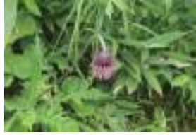
ダイニチアザミ 大日薊