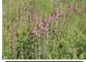
オニシオガマ 鬼塩竈