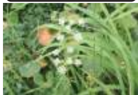
シラネニンジン 白根人参