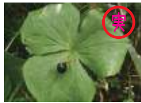
エンレイソウ 延齡草