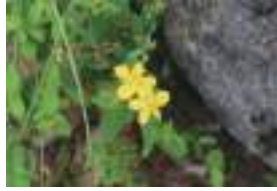
オトギリソウ 弟切草