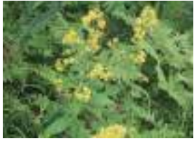
ミヤマキノキリンソウ 深山秋の麒麟草