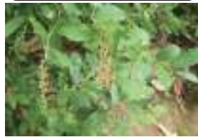
ハナヒリノキ 嚏の木