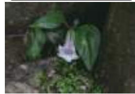
ツルリンドウ 蔓竜胆