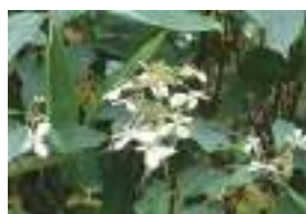
ノリウツギ 糊空木