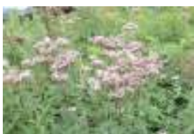
ヨツバヒヨドリ 四葉鶉