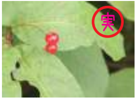
オオヒョウタンボク 大瓢箪木