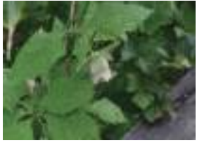
ツルニンジン 蔓人參