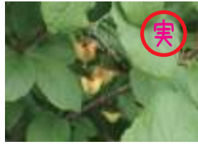
クロツリバナ 黒吊花