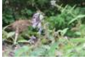
ミソガワソウ 味噌川草