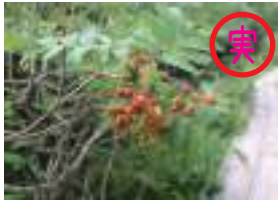
ウラジロナカマド 裏白七龍