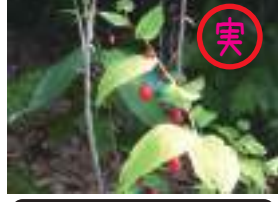
オオハタケシマラン 大葉竹縞欄