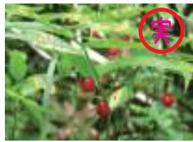
タケシマラン 竹縞欄