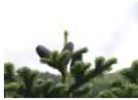
オオシラビソ 大白檜曾