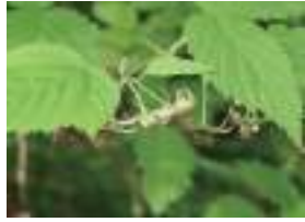
シナノキイチゴ 信濃木苺