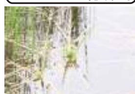
ホソバタマミクリ 細葉球実栗