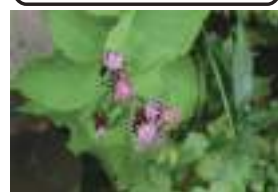
クロトウヒレン 黒唐飛廉