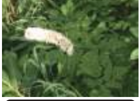
サラシナショウマ 晒菜升麻