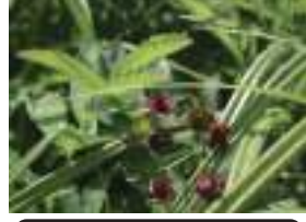
クロバナロウゲ 黒花狼牙