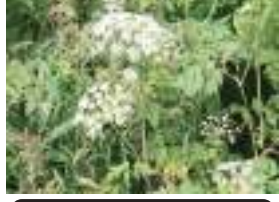
ミヤマセンキュウ 深山川芎