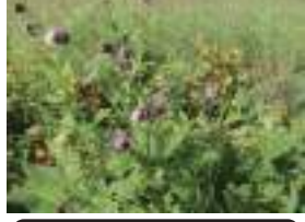
タテヤマアザミ 立山薊