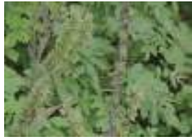
バイケイソウ 梅蕙草