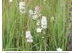
イワショウブ 岩菖蒲