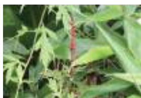
オニノヤガラ 鬼の矢柄