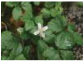
コガネイチゴ 黄金苺