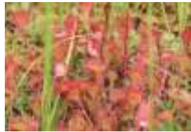
モウセンゴケ 毛氈苔