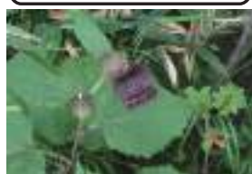
オヤマボクチ 雄山火口