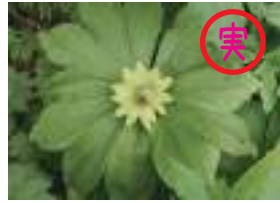
キヌガサソウ 衣笠草