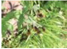
ちょうじぎく 丁字菊