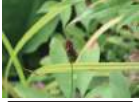
ミクリゼキシヨウ 実栗石菖