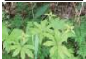
カマバツバネ 車葉衝羽根草