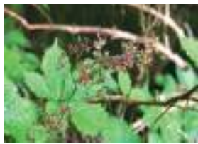
クロクモソウ 黒雲草