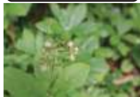
ミヤマホツツジ 深山穂躑躅