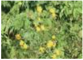
かんかごがりや 寒地鬚剃菜

8月19日現在、実が目立ち秋の気配が感じられるようになってきました。 イワショウブの白と赤がとてもきれいですよ！