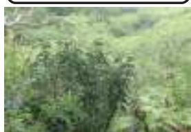
タカトウダイ 高燈台