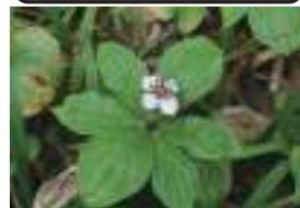
ゴゼンタチバナ 御前橘