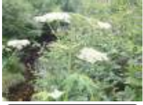
オオハナウド 大花独活