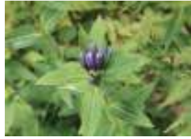
オヤマリンドウ 雄山竜胆