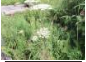
オオハセンキュウ 大葉川芎