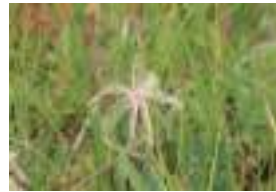
チングルマ 稚児車