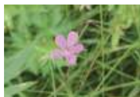
ハクサンフウロ 白山風露