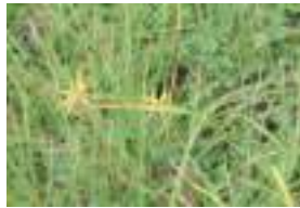
ミタケスギ 御岳菅