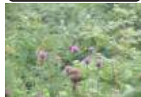
タムラソウ 田村草