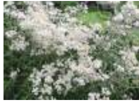
ヤマハハコ 山母子