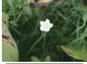
ウメバチソウ 梅鉢草