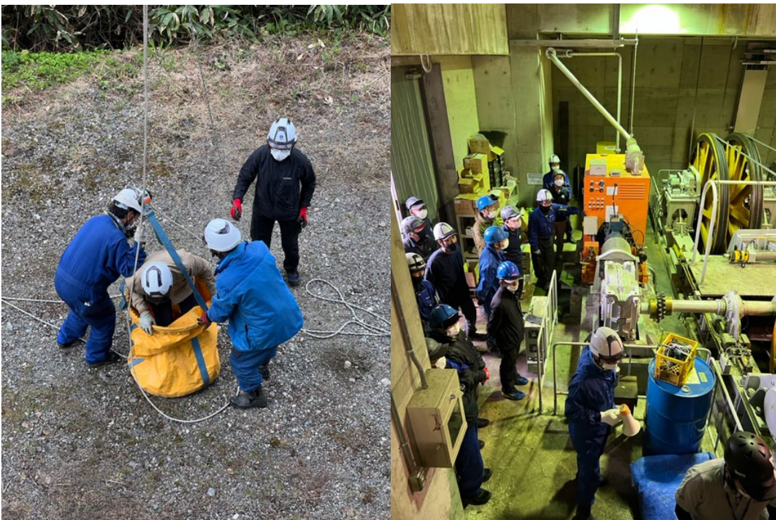
梅池ロープウェイ 救助訓練及び予備原動機訓練

索道安全運行マニュアルを作成し新人研修および、シーズン開始時に安全運行に関する研修・救助訓練を実施しています。研修は経験者、未経験者に関係なく、スタッフ全員が研修を受けられるよう数回に分けて実施し、研修は安全運行マニュアルの修得及び救助訓練に加え、サービス研修や過去の事件事例をもとにした、トラブル対応などを含めた内容にて実施しています。また、シーズン中においても定期的なミーティングを行うとともに、トラブルやヒヤリ・ハット事例を常時収集・共有し対策を講じています。また、他スキー場も含めた事故・トラブル事例も速やかに共有し注意喚起と安全向上に努めています。