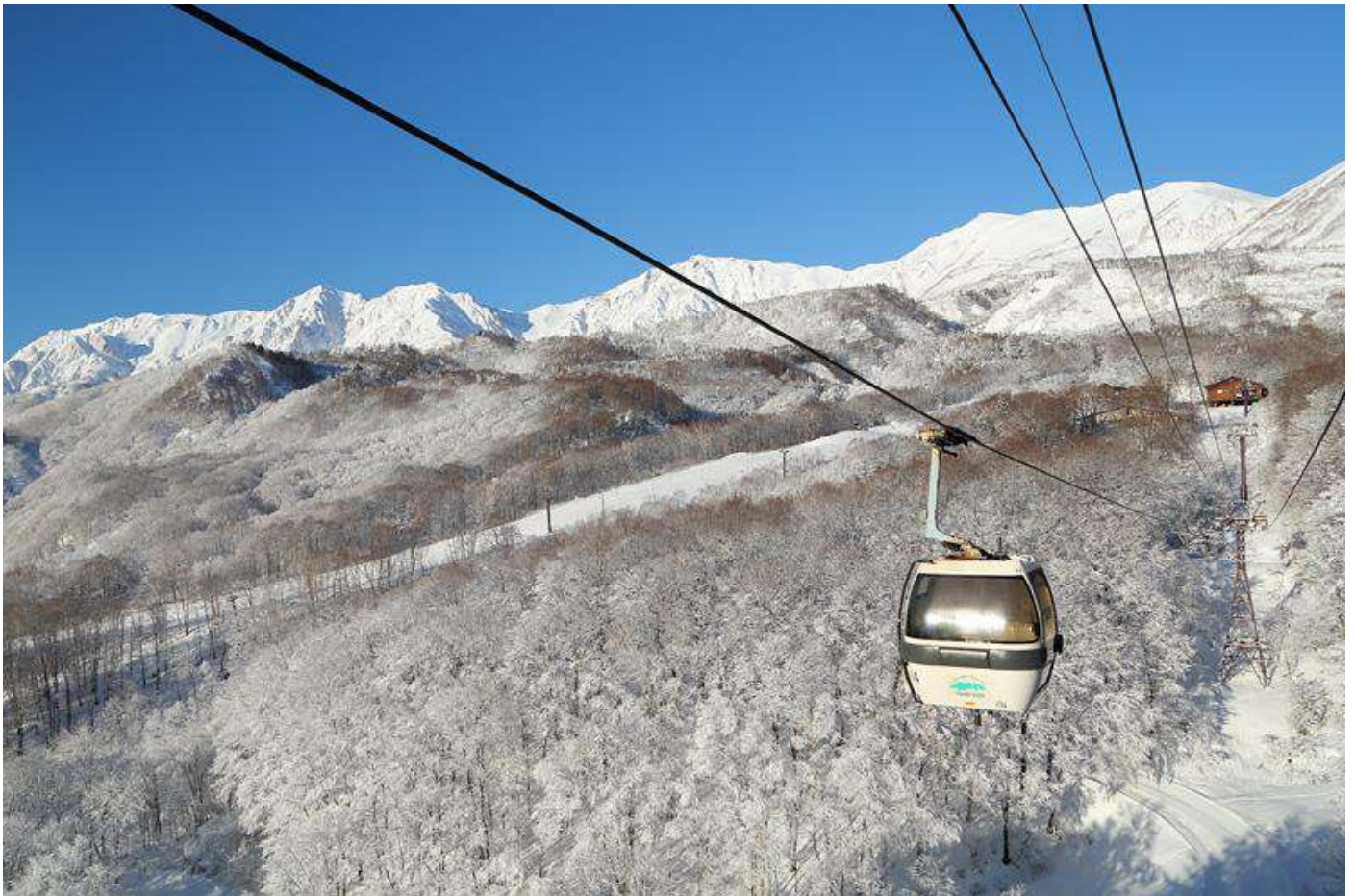
梶池ゴンドラリフト