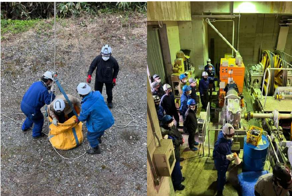
梅池ロープウェイ 救助訓練及び予備原動機訓練

索道安全運行マニュアルを作成し新人研修および、シーズン開始時に安全運行に関する研修・救助訓練を実施しています。研修は経験者、未経験者に関係なく、スタッフ全員が研修を受けられるよう数回に分けて実施し、研修は安全運行マニュアルの修得及び救助訓練に加え、サービス研修や過去の事件事例をもとにした、トラブル対応などを含めた内容にて実施しています。また、シーズン中においても定期的なミーティングを行うとともに、トラブルやヒヤリ・ハット事例を常時収集・共有し対策を講じています。また、他スキー場も含めた事故・トラブル事例も速やかに共有し注意喚起と安全向上に努めています。